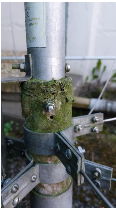
73°, Adrie, PE1DQV

Tot mijn spijt kon ik door een klein feestje thuis niet bij de afgelopen test - en knutselzondag aanwezig zijn, ik had (onder andere aan mezelf) beloofd die dag low&slow pulled pork in de kamado te maken en me daarbij niet gerealiseerd dat ik deze dan voor dag en dauw moet opstoken waarna het geheel ook nog regelmatig aandacht vraagt zodat de temperatuur mooi stabiel blijft en het garingsproces gecontroleerd verloopt. De pulled pork was een succes en vraagt om herhaling (wordt vervolgd) maar ik heb daardoor helaas het een en ander op radiogebied moeten missen (sorry Gerard). Alles bij elkaar zijn deze testzondagen succesvol en houden we ze erin, al verwacht ik dat we ons in het koude en natte seizoen misschien iets meer op binnen activiteiten zullen gaan concentreren, maar ook hier geldt: wordt vervolgd. Als laatste had ik gehoopt in deze nieuwsbrief iets meer over de R7 verticale antenne die ik op de kop getikt heb te kunnen vermelden, maar het ding wil nog niet echt resoneren en is in zeer matige conditie, en er is dus nog veel werk aan de winkel dus ook dit wordt vervolgd.