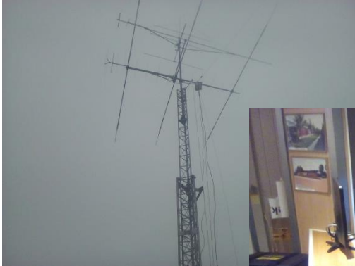
PI4VHW van af de thuislocatie in Puttershoek

In de afgelopen maand zijn op twee plaatsen stations van de afdeling actief geweest met de PACC van 2017